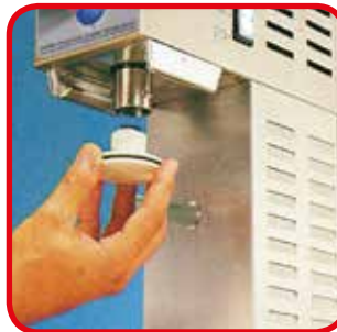
Pistón en Makrolon ® fácilmente removible per una perfecta limpieza