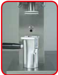
Moldes en aluminio anticorodal. Molde spaghetti de serie