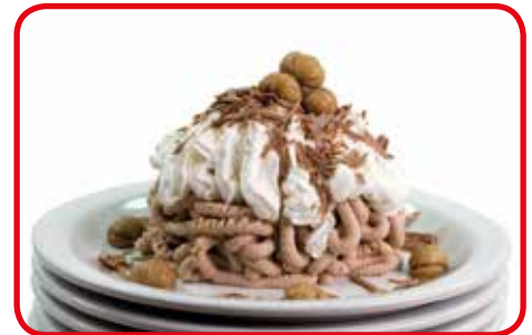
Composición obtenida con el molde "Spaghetti"