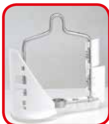
Agitador compuesto por pala de vela y espátula