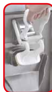
Máxima comodidad de la salida de la crema