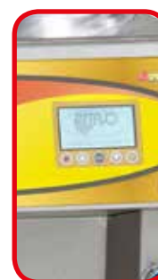
Todas las informaciones se presentan en display multilingue