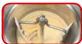
Primera fase de la transformación con azúcar, harina/almidón

*dispositivo especial de aplicación patentado que permite variar la velocidad de agitación del mezclador