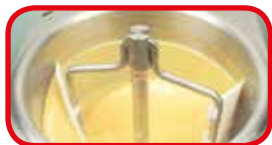
Segunda fase con yema de huevo y leche