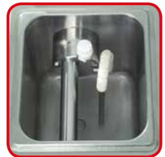
Cuba con refrigeración directa