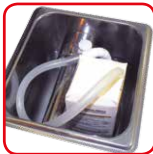
Posibilidad de enganchar la bomba directamente a la producción de nata