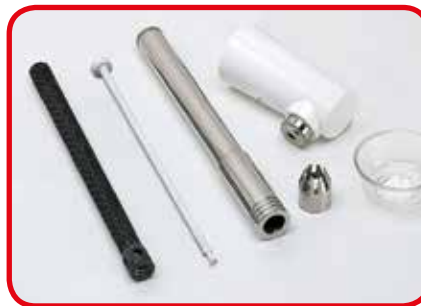
Componentes del sistema de erogación completamente desmontables para una perfecta limpieza del recipiente