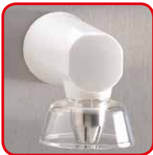
Boquilla en acero inox